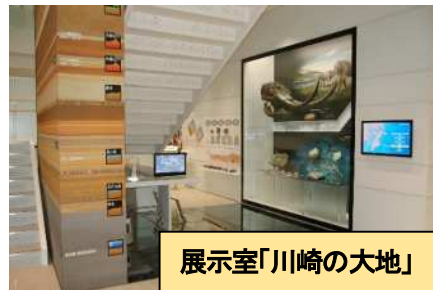
展示室「川崎の大地」